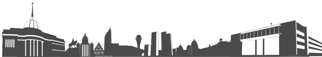
Рисунок 1 – Название рисунка